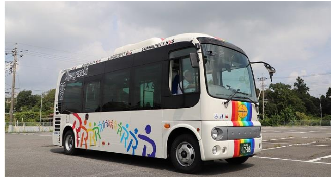
▲体験で使用する本市コミュニティバス車両